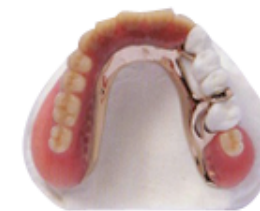
ミラクルデンチャー