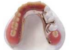
ミラクルデンチャー